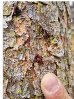
Frisches Einbohrloch am Stamm (Foto: Land Tirol).

Welche Maßnahme zur Bekämpfung anzuwenden ist, hängt vom Entwicklungsstand der Brut ab.: